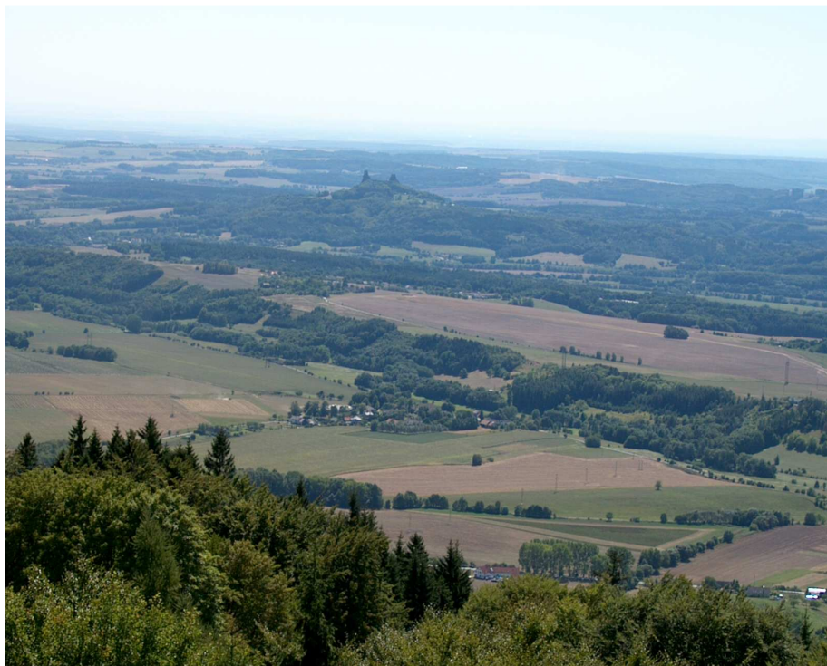
Pohled z Kozákova na jižní část Českého ráje s Troskami (foto autor, srpen 2003)

Nad Loktuší je na kraji lesa v nadmořské výšce 530 m studánka. Studánku si pro její výbornou vodu lidé považovali a postavili nad ní malou otevřenou kapličku zasvěcenou Panně Marii Radostné. Odtud název studánky Radostná. U studánky je slyšet pravidelný rytmus trkače (pumpy speciální konstrukce), který vytlačuje vodu do Riegerovy chaty na vrcholu, tedy přes převýšení 214 metrů.