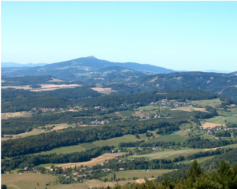
Pohled z Kozákova přes Ještědsko – kozákovský hřbet k Ještědu (foto autor, srpen 2003)