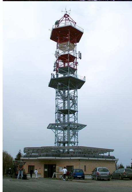
Riegerova turistická chata, stav před poslední rekonstrukcí v r. 2003. Při opravě zmizel známý nápis (CHATA NA KOZÁKOVĚ – 743m). Pro vrchol Kozákova se dnes udává výška 744,1 metrů nad mořem. (srpen 2003) ←