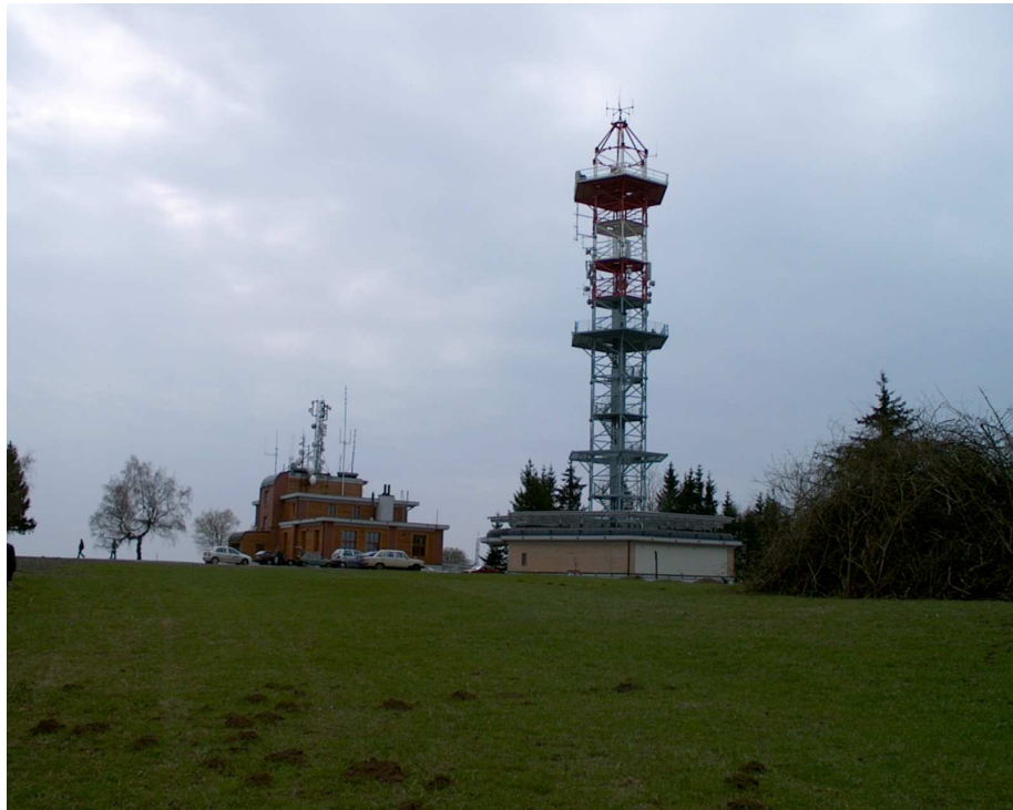
Vrchol Kozákova s Riegerovou chatou a rozhlednou. Vpravo halda připravená k pálení čarodějnic. Alespoň 30. dubna si můžeme udělat představu, jak daleko bylo vidět strážní oheň z Kozákova, který signalizoval nebezpečí. (foto autor, duben 2004)

Na severovýchodě je vidět hradba Krkonoš od Černé hory až k nejzápadnějšímu výběžku. Vedle nich jsou na severu hory Jizerské a mohutný masiv blízkého Ještědu. Vlevo od něho se zdvihají vrcholy Lužických hor a na západ potom homole Českého středohoří. Před nimi je charakteristická silueta Bezdězu. Jižněji vystupuje nad obzor nezaměnitelná silueta Řípu a ještě více k jihu se díváme ku Praze. Za ideálního počasí by měla být vidět Petřínská rozhledna. Na jihu Trosky a Český ráj, jihovýchodně rozlehlá rovina zakončená Českomoravskou vrchovinou. Pohled na východ je k Táboru a Kumburku (celé Lomnicko je odsud jako na dlani) a za nimi je výhled až k Jestřebím a Orlickým horám.