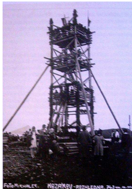
Provizorní rozhledna byla postavena na Kozákově někdy kolem r. 1925 → Vojenská komunikační věž sloužící jako rozhledna od r. 1993